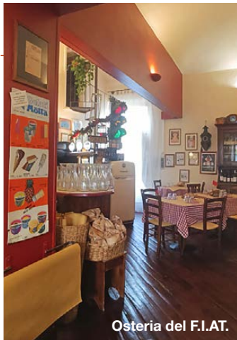
Osteria del F.I.A.T.