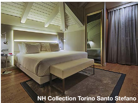
NH Collection Torino Santo Stefano